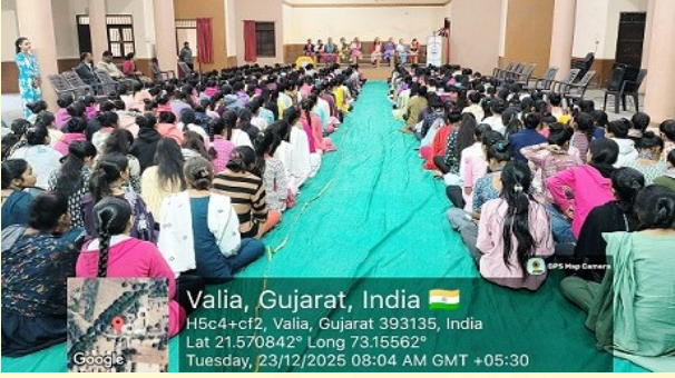
Valia, Gujarat, India H5c4+cf2, Valia, Gujarat 393135, India Lat 21.570842° Long 73.15562° Tuesday, 23/12/2025 08:04 AM GMT +05:30