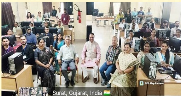
Surat, Gujarat, India